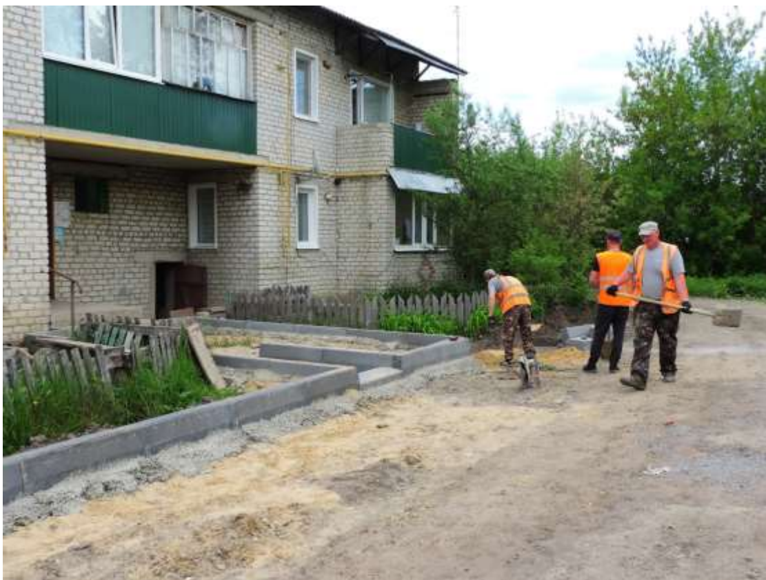
14. Проводится спиливание и формовка зелёных насаждений