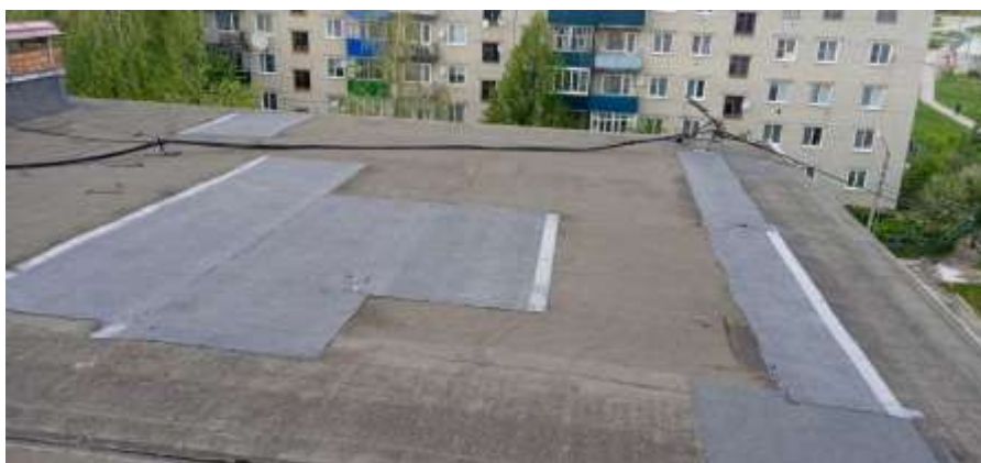
9. Проведён ремонт дымветканалов на кровле дома № 2 «Е» по улице Николаева