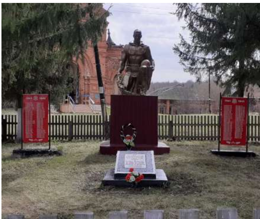
16. Проводился косметический ремонт детских площадок на общественных пространствах